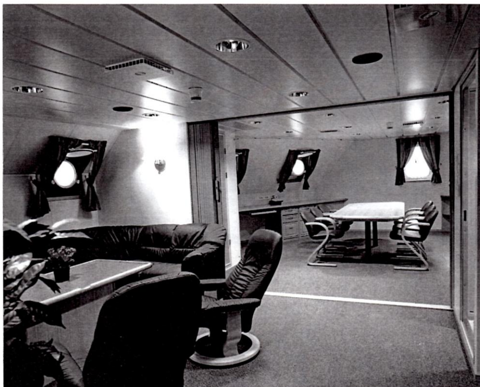
Fra Skipssjefens lugar ombord i kystvaktfartøyet "Tromsø"